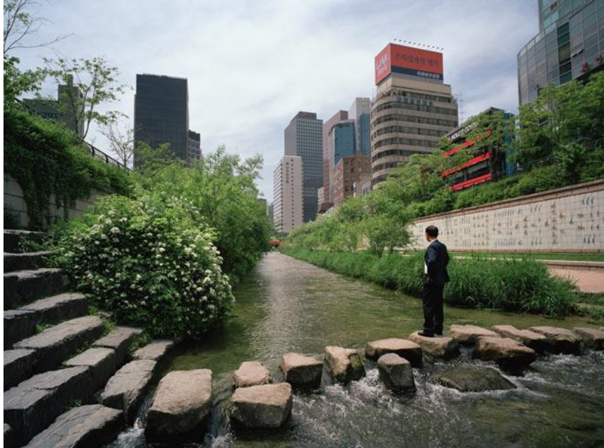
Imagen N003: Uso construcción sostenible en ambientes urbanos

La arquitectura sostenible puede contribuir a la recuperación de espacios urbanos y rurales al transformar áreas degradadas en espacios habitables y ecológicos.