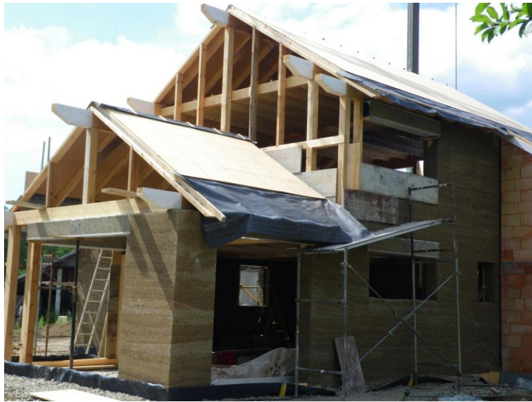
Imagen N03: Construcción vivienda unifamiliar usando estructuras de cáñamo.

Estimados aprendices esta actividad está orientada a identificar según información vista en el ambiente de aprendizaje en donde realizara una lista de chequeo a una construcción en su región que identifique como sostenible por su impacto positivo al medio ambiente o el uso de materiales sostenibles – Socialice en el ambiente de aprendizaje con evidencia fotográfica.